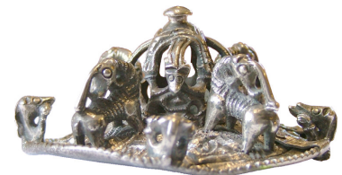
Fig. 2. Runt silverspänne av barock typ från Väsby i Skå /Uppland.

Kontakt: michaelneiss@hotmail.com Hemsida: http://michaelneiss.hardell.net