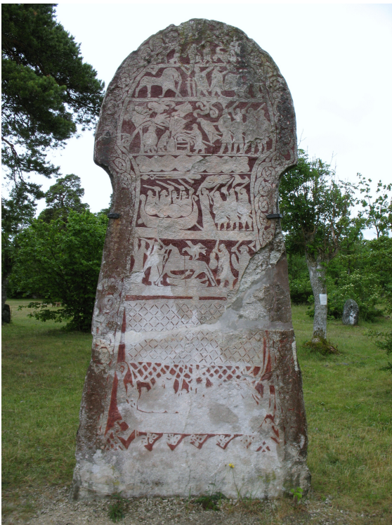
Bungemuseet. Bildsten från Stora Hammars, Lärbro.

Historiska museet innehåller inte bara en massa fantastiska föremål utan är också en riktigt spännande byggnad, full av historiska referenser och detaljer. Var hittades inspirationen till tornvalvet och varför gjorde man en liten modell av en landskyrka mitt i museet? Följ med 1:e antikvarie Pia Bengtsson Melin på en visning av museets arkitektur och den konst som finns där. Visningen avslutas med bubbel under robinian på Rosengården.