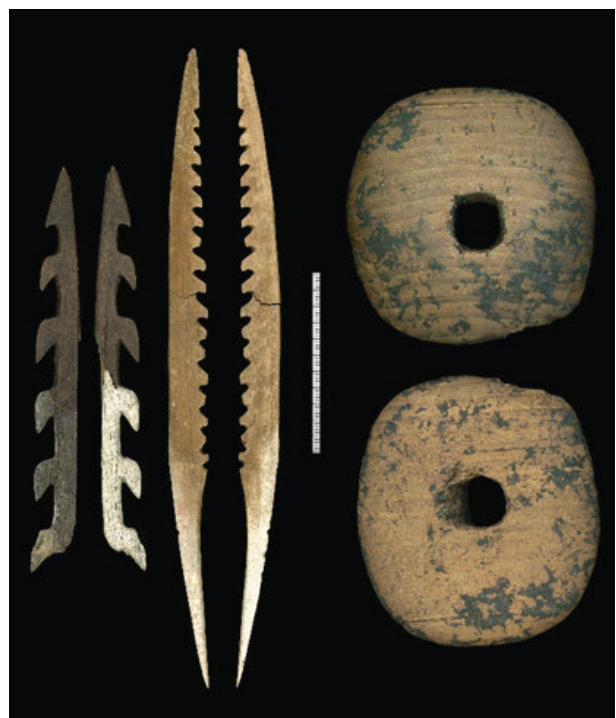
Undersökningarna vid Dagsmosse i Östergötland och ett urval av fynden härifrån.

Emellertid förstörs fornlämningarna kontinuerligt genom den fortsatta torvbrytningen.