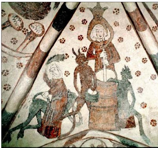
Muralmålning, Västra Vemmenböje, Skåne. Smörkärnande kvinnor. Lilla Harrie-mästaren, omkring 1500.

Men hur såg dessa egentligen ut under vikingatiden eller medeltiden? Hur kan vi se dem? Vad ändrades med kristendomen? Och hur på-verkar våra uppfattningar om magi och trolldom idag våra tolkningar av häxor och trolldom i det förflutna?