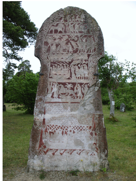
Bungemuseet. Bildsten från Stora Hammars, Lärbro.

Muralmålning, Västra Vemmenhög, Skåne. Smörkärnande kvinnor. Lilla Harrie-mästaren omkring 1500.