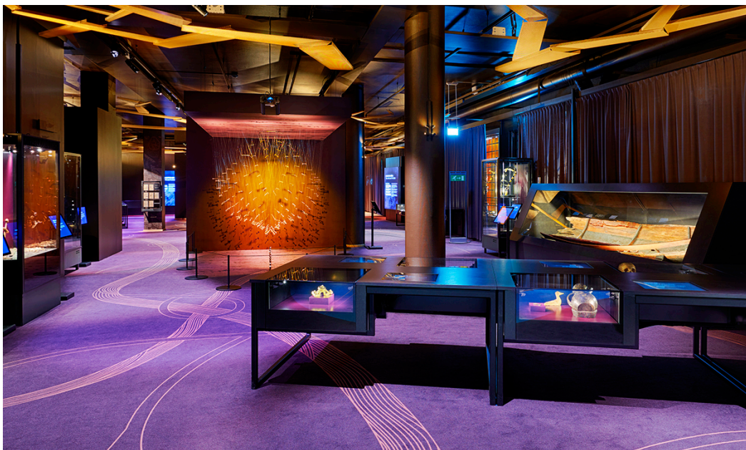
Vikingautställningen är 1 000 kvadratmeter stor och berättar om Vikingarnas värld utifrån tio olika teman.

Sommaren 2021 invigdes den nya permanenta utställningen "Vikingarnas värld" på Historiska. Den 19 februari får du chansen att besöka den tillsammans med Fornminnesföreningen och den kunniga museipedagogen Linda Wähländer.